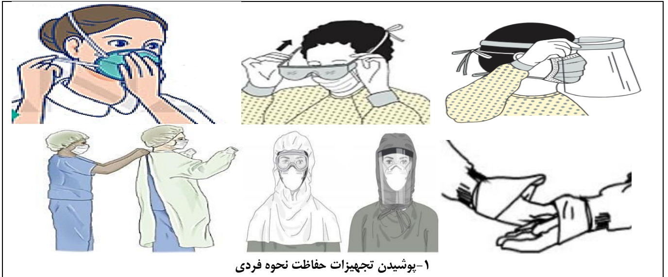
۱- پوشیدن تجهیزات حفاظت نحوه فردی