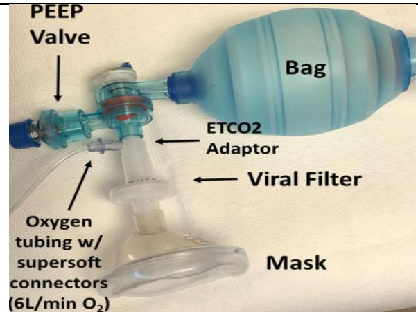
۳- نمونه آمبوبگ فیلتردار مناسب بیمار مبتلا به کووید ۱۹