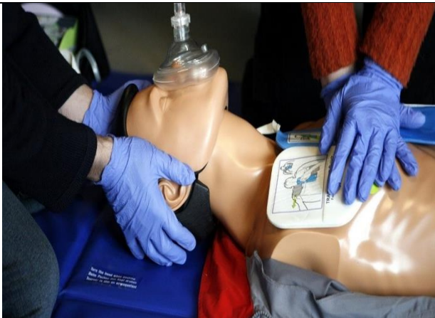
۴- نحوه استفاده از AED در شرایط کرونا با رعایت پروتکل های بهداشتی