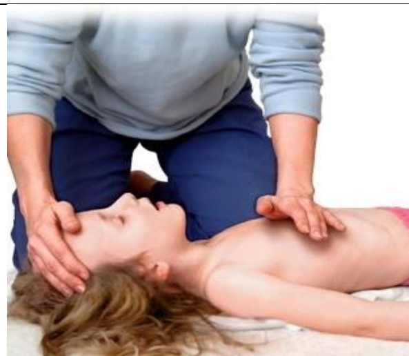
۴- نحوه ماساژ قلبی به شیوه یک دستی