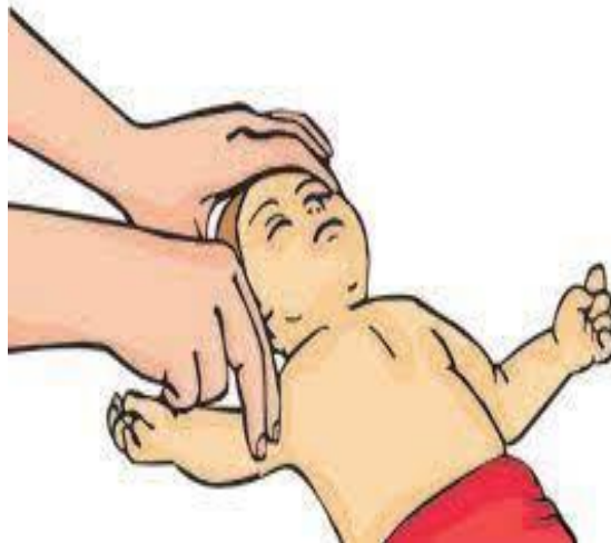
۳- نحوه چک نبض براکیال