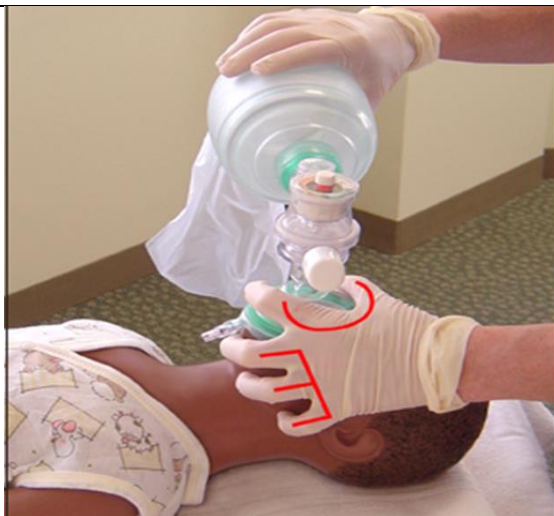
۵- شیوه صحیح استفاده از آمبویگ ( تکنیک C و E )