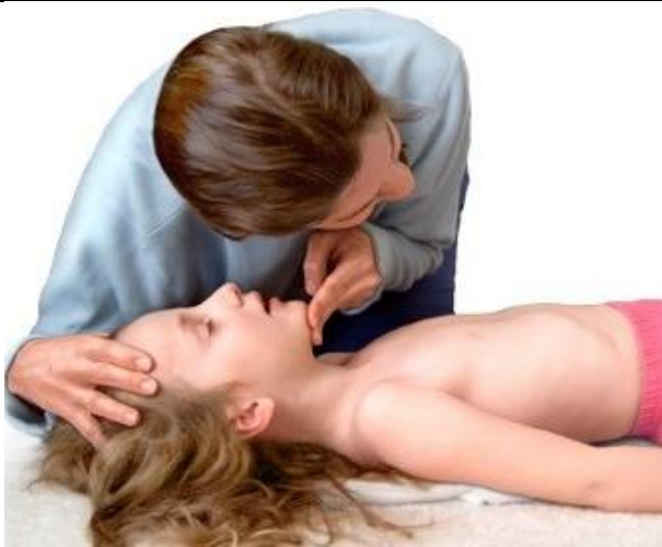
۱- بررسی بیمار از نظر عدم تنفس یا تنفس غیرطبیعی و باز کردن راه هوایی