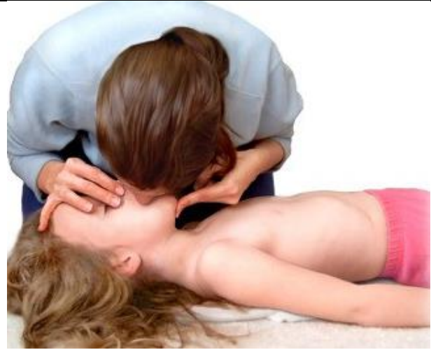
۲- نحوه انجام تنفس دهان به دهان